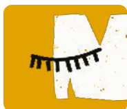
WZÓR OD KLIENTA