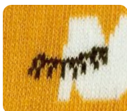
WZÓR WYKONANY NA SKARPECIE

Każde oczko w skarpecie wykonane jest z przędzy w danym kolorze. Wzór wykonany tą techniką jest bardzo trwały i elastyczny, jednak nie tak dokładny jak nadruk.